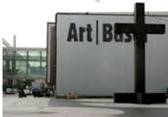
Valentin Carron Fosbury Flop , 2009 Holz, Stahl, Farbe 1100 x 628 x 110 cm Galerie Eva Presenhuber, Zürich (Public Art Projects)