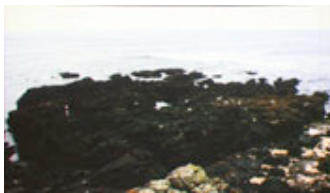
mahony Version I, Cape Cornwall , 2008 Video, bemooster Fels 2.000 EUR Layr Wuestenhagen Contemporary, Wien (Liste 09)