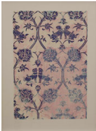
Natalie Czech Fragment , 2009 Siebdruck auf Seide 94 x 70 cm; Ed. 3+1 2.000 EUR Schnittraum/Lutz Becker, Köln (Liste 09)

ERÖFFNUNG DER LISTE UND ART UNLIMITED, BASEL