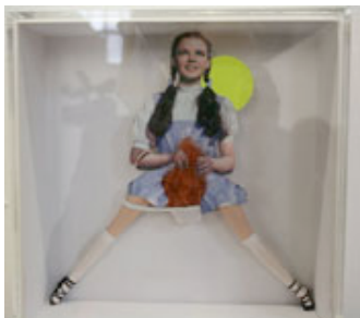
Eli Cortinas The most reddish pubis ever seen , 2007 Teile einer Barbie-Puppe, Judy Garland-Foto, Schlüpfer, Schuhkarton unter Plexiglas 2.500 EUR Galerie Michael Wiesehöfer, Köln (Liste 09)