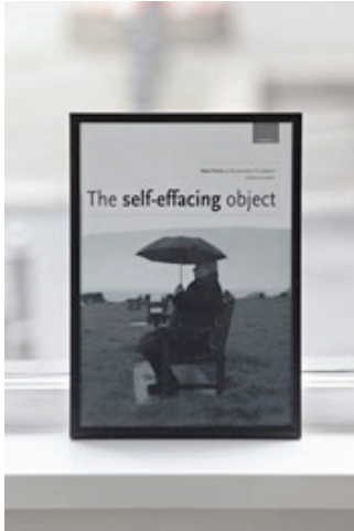
Pavel Büchler Self-effacing Object , 2008 Gefundenes und eingerahmtes Magazin 29,7 x 21 cm